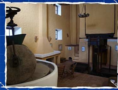
HOTEL ALMEJÉ. BENADULÍ